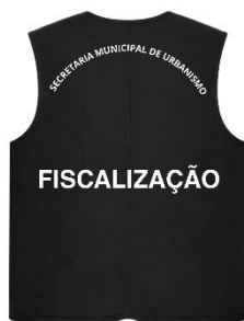
OPÇÕES DE COLETE URBANISMO FISCALIZAÇÃO