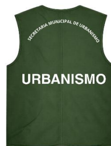
OPÇÕES DE COLETE URBANISMO